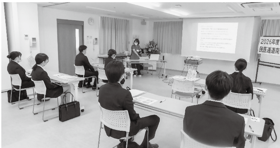
研修会を聞く新入職員たち

その後4日(土)の歓迎会では、和やかな雰囲気の中で交流が深まりました。最初は緊張していた新入職員も、自己紹介や先輩職員との会話を通じて次第に笑顔を見せ、打ち解けた様子が見えられました。厳しい冬を越え、春に芽吹く大地のように、新たな仲間たちの今後の成長と活躍に大きな期待が寄せられています。